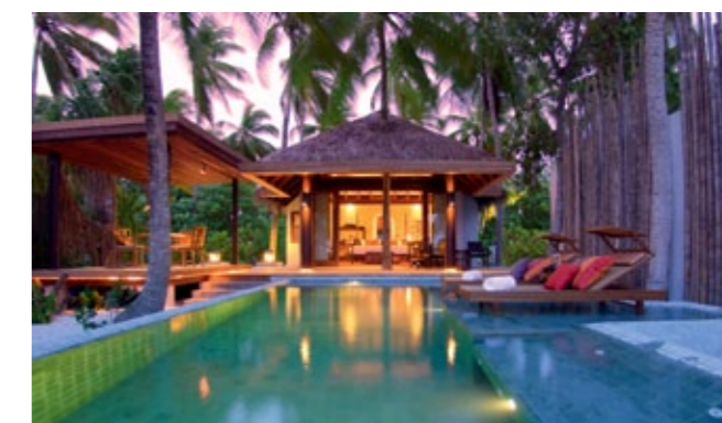
Einige der Highlights der Malediven: das One&Only Reethi Rah (oben), Alila Villas (unten links), Anantara Kihavah Villas, Eröffnung Dezember 2010 (unten rechts).