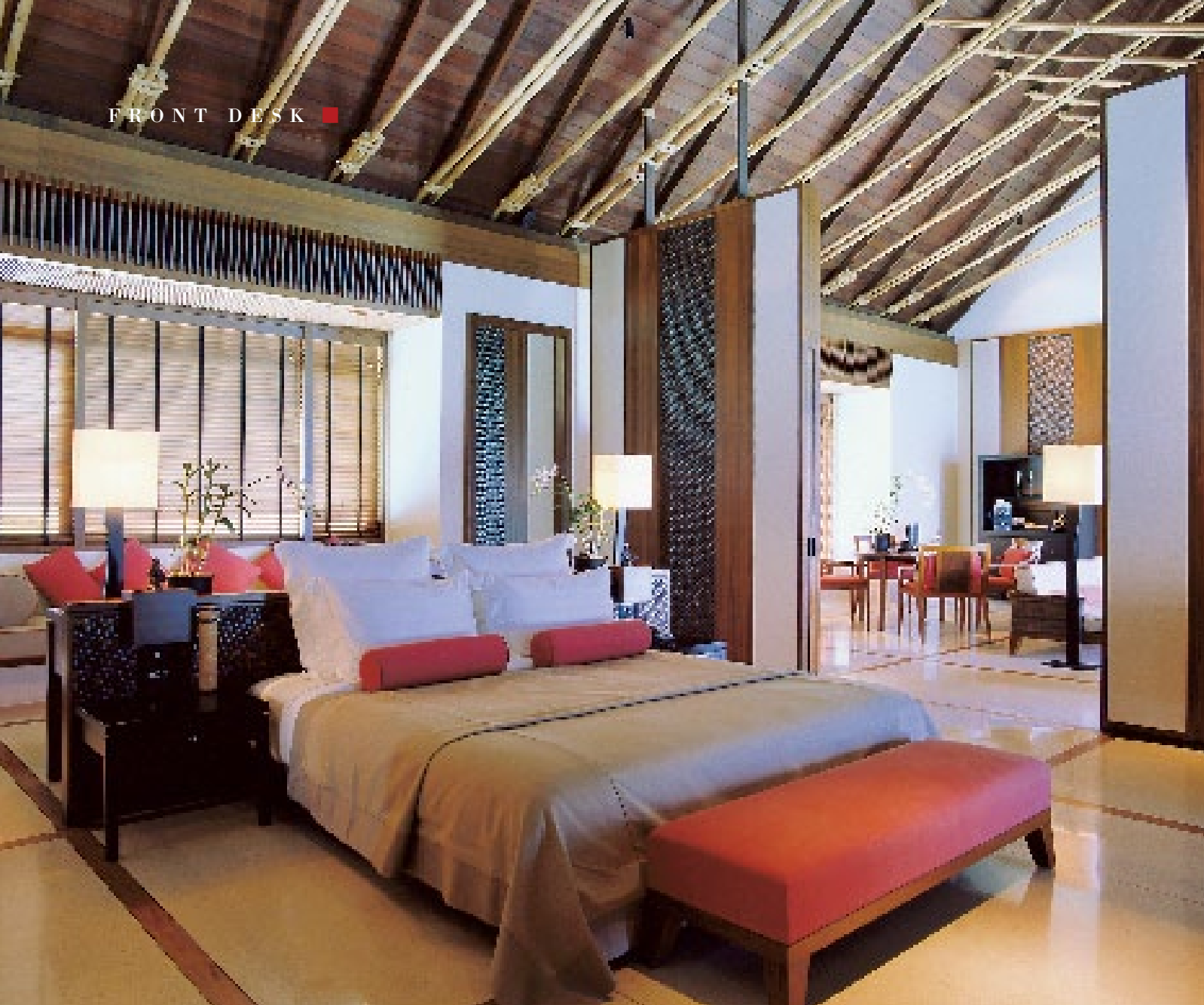
Stilvolle Eleganz und fernöstliche Elemente prägen die Interieurs der Beachvillen auf Reethi Rah.